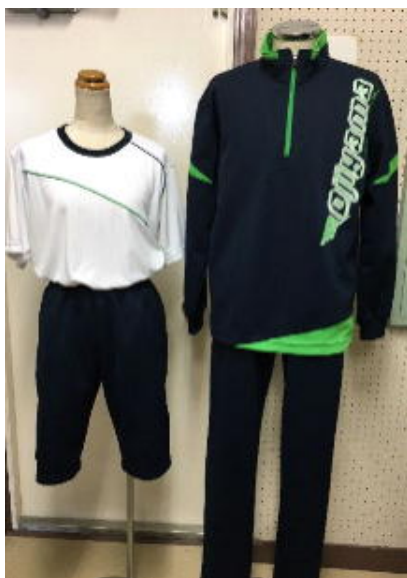
夏服・ポロシャツ着用時